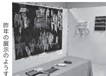
昨年の展示のようす