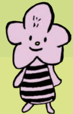
つつじがおかじどうかん つつじヶ丘児童館 つつじまくん