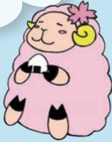
そめちじどうかん 染地児童館 そんめえ～