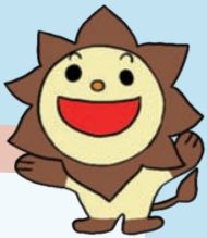
こくりょうじどうかん 国領児童館 ひまライ