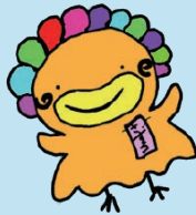
さずじどうかん 佐須児童館 さずら