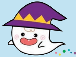
ちょうふがおかじどうかん 調布ヶ丘児童館 ドロン