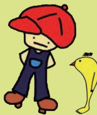
青少年ステーション CAPS グッティ（左）とようすけ（右）