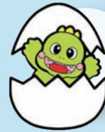
たまがわじどうかん 多摩川児童館 たまごん