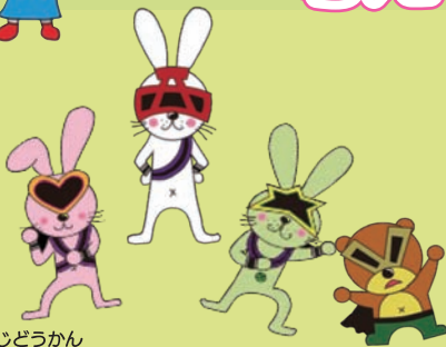
せいぶじどうかん 西部児童館 交流戦隊ウエスターズと悪役ダークベア こうりゅうせんたい あくやく