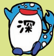
じんだいじじじどうかん 深大寺児童館 じんじん