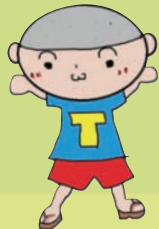
とらぶじどうかん 東部児童館 とーぶくん と とーびいもうと