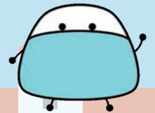
ふじみじどうかん 富士見児童館 ふじみちゃん