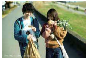
「花束みたいな恋をした」 監督：土井裕泰 脚本：坂元裕二 出演：菅田将暉、有村架純 ほか

訪日観光客の受け入れに向けて、「(株)地球の歩き方」と連携し、多言語版デジタルサイトの配信を開始しました。この機会に、市がメインロケ地の映画「花束みたいな恋をした」のロケ地を巡ってみませんか。