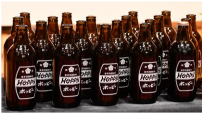
リターナブルびん

リユースすることで、その都度ガラスびんを製造する必要がなく、製造に要するCO2排出量の削減および、天然資源やエネルギーの節約、ごみ排出量の削減に繋がります。ガラスびんは3Rに最適の容器です。