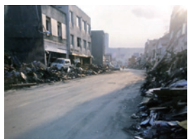
東日本大震災時の講師実家前

東日本大震災で、講師の故郷 岩手県釜石市は津波にのめられました。幼少期から聞かされてきた過去の津波伝承、釜石市の歴史や地形を踏まえ、東日本大震災を地元住民の目線から振り返る講演会を、昨年初めて市内中学校で開催しました。震災から15年の今年には第八中学校で生徒と一緒に災害について考えます。