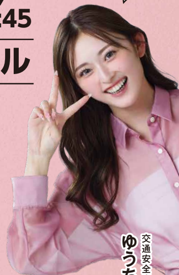
交通安全広報大使 ゆうちやみ