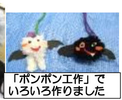
「ポンポン工作」でいろいろ作りました