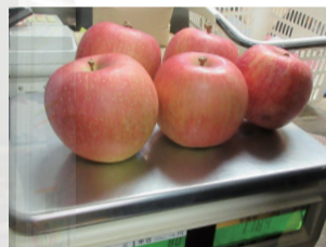
◀ りんごの量り売り