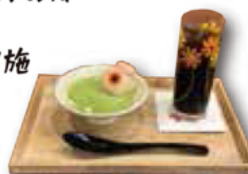
〔例〕「甘味 an&」 限定メニュー