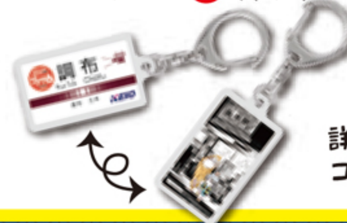
限定駅名キーホルダー(イメージ)