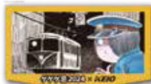
記念ヘッドマーク(イメージ)